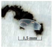
Œuf et déjections

Échangez avec les autres randonneurs et les hébergeurs sur cette problématique.