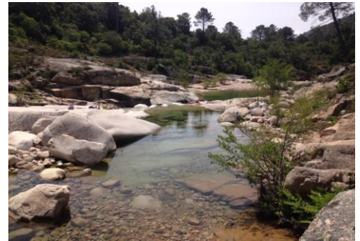
Site de baignade du Cavu

Ainsi, si une personne malade urine dans l'eau, et que le parasite rencontre un bulin, un cycle de contamination local peut se produire.